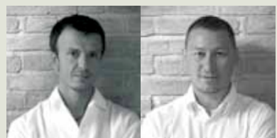
ARCHISTUDIO Alberto Castellari Stefano Cavina

Vista esterna della cantina che si sviluppa in due corpi collegati da un corridoio vetrato.